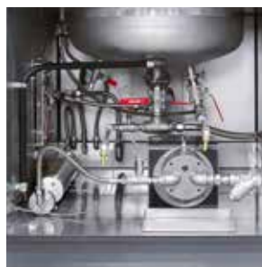
Pumpe mit Magnetkupplung