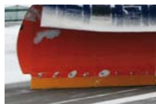
Räumleiste & Schneeabweiser